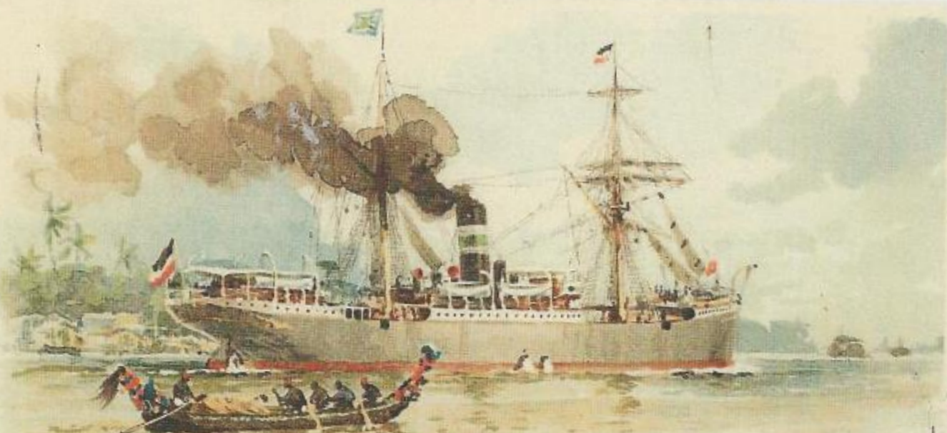
Woermann-Dampfer im Kamerunflusse.

Meissner & Buch Leipzig Kunstler-Reservatien-Denk 1012 demerit-geschichtl